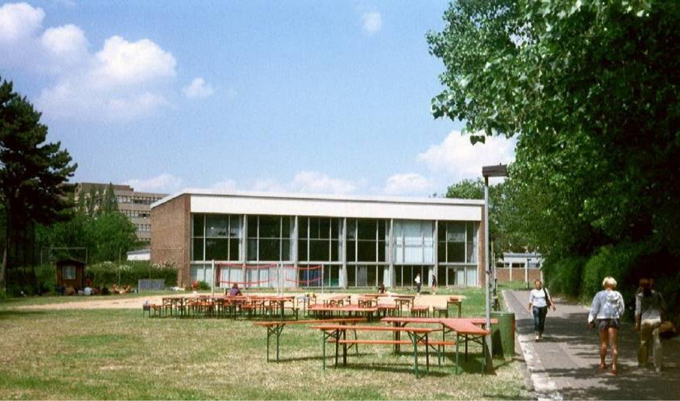
Schwimmhalle & Sauna